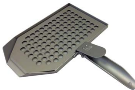
写真は硬質アルマイト処理