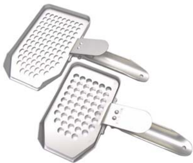
写真は表面処理なし