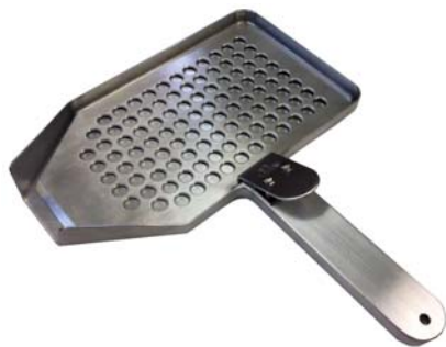
写真は表面処理なし